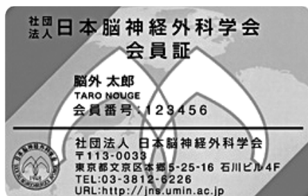
(A)一般社団法人日本脳神経外科学会会員証

「一般社団法人日本脳神経外科学会会員証」を用いて、参加費のお支払い・専門医クレジットのご登録が出来ます。（一般社団法人日本脳神経外科学会会員のみ）